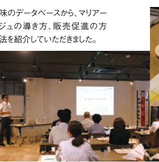
味のデータベースから、マリアージュの導き方、販売促進の方法を紹介していただきました。