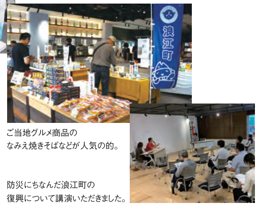
ご当地グルメ商品のなみえ焼きそばなどが人気の的。防災にちなんだ浪江町の復興について講演いただきました。

9月1日(日)の防災の日をきっかけに、まるまるひがしにはん、大宮銀座通り商店街、OMTEERRACEの3箇所を結んだイベント「えきまえばうさいフェスタ」が行われました。まるまるひがしにはんでは東日本大震災で大きな被害を受けた福島県浪江町をお招きし、シティプロモーションを開催。なみえ焼きそばやえこまじャンなどのご当地商品が人気を呼び、大勢のお客様が来館を頂き賑わいを見せました。2階ビジネス交流サロンでは浪江町の経験をもとにした街づくり講演や防災の知識など、9つの講座が開かれ130人ほどが参加。ご来場のお客様の防災知識向上に役買ったイベントとなりました。