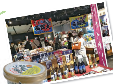
函館ならではの商品が勢ぞろい。「函館」という文字に惹かれて来ました」といった声も。

その後、両市は販路開拓・商品開発の商談会を実施。函館市の事業者は「通常、問屋経由となる事業者と直接話ができ、良い収穫ができた」と満足いただけた様子。両市の商工会議所の連携で、新たなビジネスが生まれそうです。