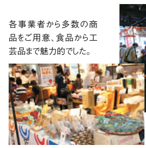
各事業者から多数の商品をご用意、食品から工芸品まで魅力的でした。

お酒どころの3市が合同イベントを開催しました。数多くのお酒は勿論、150種を超える地場産品の数々で、直接事業者の方々が販売し賑やかな店内となりました。店内カウンターで試飲・試食等も提供し、3市の食PRが十分にできたのではないかと思います。また、2階でも赤べこの絵付け体験や白虎隊演舞、観光PRのトークショーを開催するなど、シティプロモーションにも力を入れたイベントとなりました。