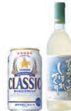
はこだてわいんや北海道限定のサッポロクラシックを販売。