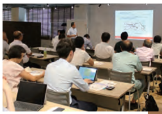
災害現場等で必須となる電力を容易に持ち運べる、画期的な技術をご紹介いただきました。