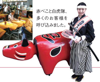
店内は秋の装飾。レストスペースまで大賑わいです。