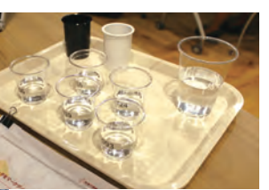
無色無臭の溶液で味覚テストを実施。視覚や嗅覚など様々な要因で味の感じ方に差が出るのが分かります。

今回の味トレンドレポートセミナーは「味データをマーケティングに活用する」というテーマで開催しました。人の味覚の感じ方を味覚テストを絡めて学び、それを踏まえて味覚のデータベースからこの食品・飲料がマッチするという法則の導き方を紹介していただきました。また、そのマリアージュからどう販売促進に繋げるのか、事例を基に学ぶ機会となりました。