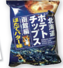
函館山からの夜景がデザインされたほたてバター味のポテトチップスが人気でした。